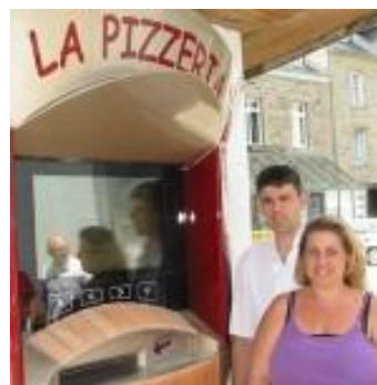
LA PIZZERIA à Tréguier (22)