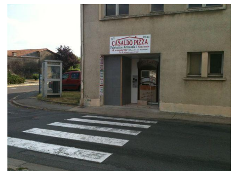
CASALDO PIZZA à Gençay (86)