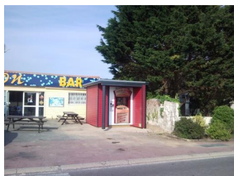
123 PIZZA à Landevieille (85)