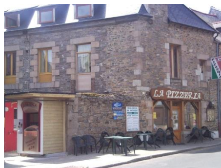
LA PIZZERIA à Tréguier (22)