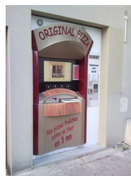
ORIGINAL PIZZA à Grand Champ (56)