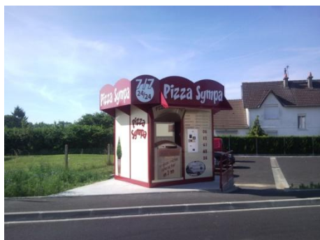
PIZZA SYMPA à La Haye-Malherbe (27)