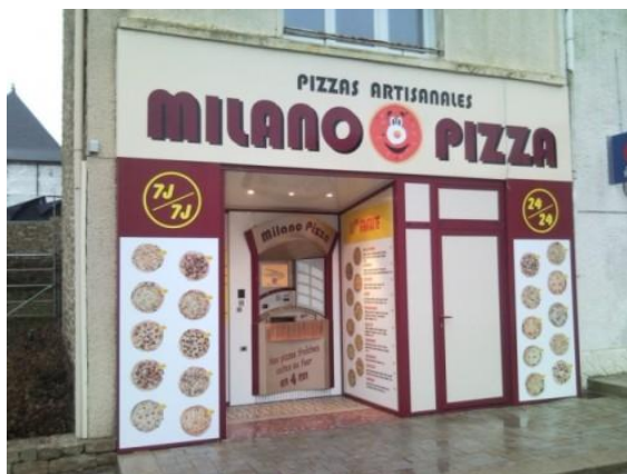
MILANO PIZZA à PEAULE (56)