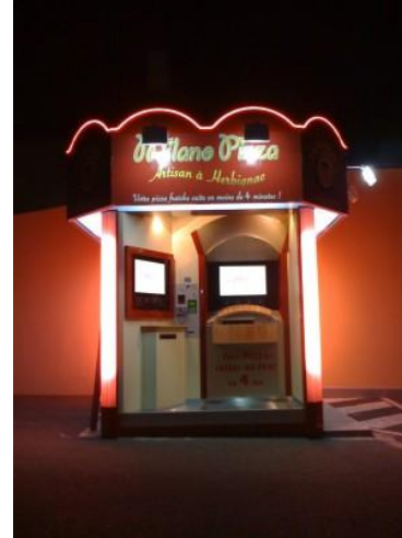
MILANO PIZZA à SAINT-NAZAIRE (44)