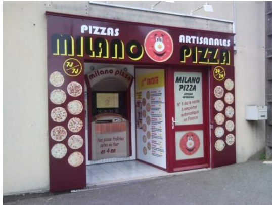
MILANO PIZZA à NIVILLAC (56)