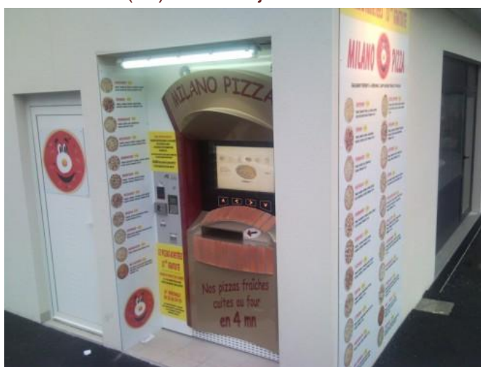
MILANO PIZZA à CAMOEL (56)

MILANO PIZZA fait confiance à la société ADIAL en basant sa stratégie de développement uniquement sur les distributeurs PIZZADOOR. Le projet est d'installer et exploiter un réseau de 8 distributeurs d'ici fin 2012. En mai 2011, le 5ème distributeur a été installé à Camoël (56) avec toujours la même réussite commerciale :