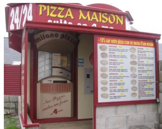
MILANO PIZZA à HERBIGNAC (44)