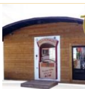
5370 Havelange - Belgique