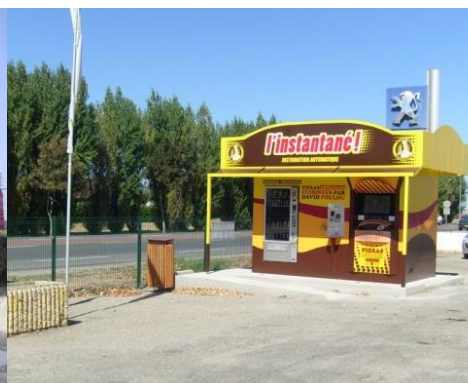
4 ème distributeur L'INSTANTANÉ à Tonneins (47) www.linstantane.fr