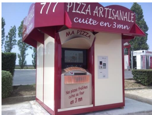
MA PIZZA à Château Renault (37)