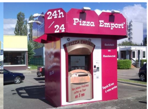
PIZZA EMPORT' à Rixheim (68) www.pizzaemport.com