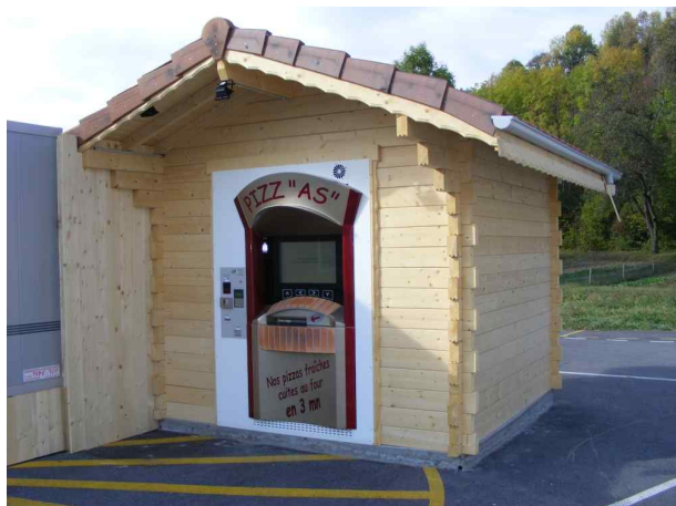
« Pizz'As' » à Pont de Fillings (74)