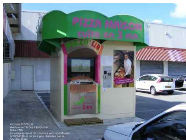
« PIZZA'LIB » à Méré (78)