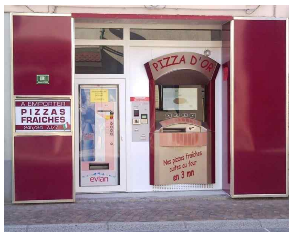
« Pizza d'Or » à Bons en Chablais (74)