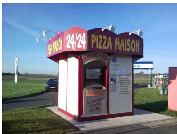
« La cabane » à Doué la Fontaine (49)