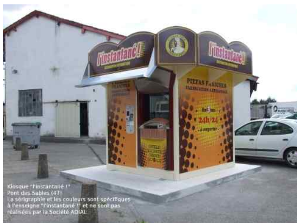
« l'instantané ! » à Pont des Sables (47)